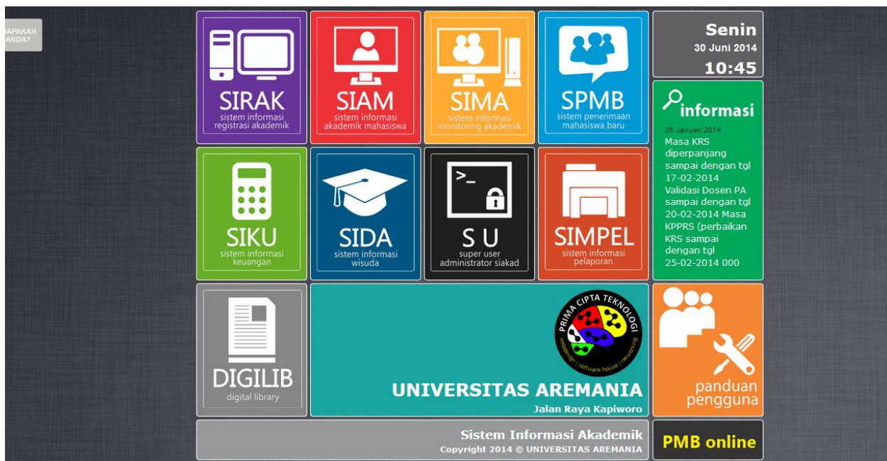
Gambar 2. Lihat Website

Menu Website ini untuk melihat halaman utama website.