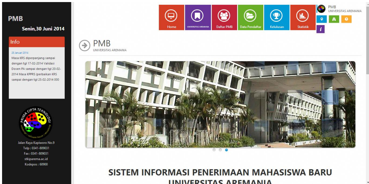
Gambar 1. Halaman Utama PMB

Setelah klik pmb, akan tampil halaman utama PMB sebagai berikut: