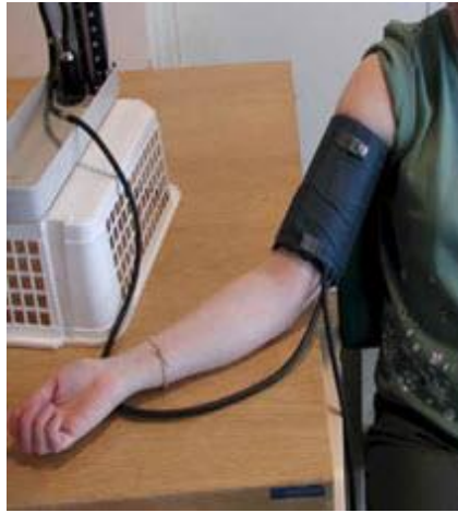
Gambar 1. Posisi pengukuran tekanan darah Anonim, 2011 dalam http://www.medikalholistik.com

Pemeriksaan tekanan darah sebaiknya dilakukan dalam posisi duduk dengan siku lengan menekuk di atas meja dengan posisi telapak tangan menghadap ke atas dan posisi lengan sebaiknya setinggi jantung (Hananta Y, 2011). Adapun gambar posisi pengukuran tekanan darah dapat dilihat pada gambar 1.