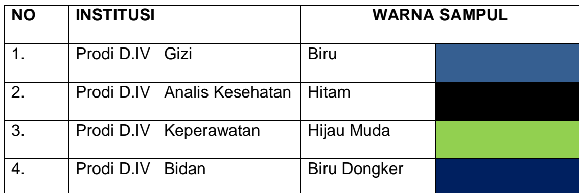
Tabel 3.1. Warna sampul Skripsi sesuai dengan Jurusan / Program studi D-IV.

Terbuat dari bahan yang keras ( Hard Cover ) dan tulisan dibuat dalam bentuk cetakan dengan tinta emas . Tulisan atau isi sampul memuat informasi tentang :